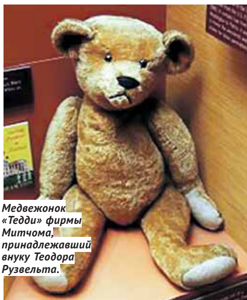
Медвежонок «Тедди» фирмы Митчона, принадлежавший внуку Теодора Рузвельта.

ФАКТ Найди лишнее: Винни-Пух, Рузвельт, Новониколаевск или медвежонок Паддингтон.