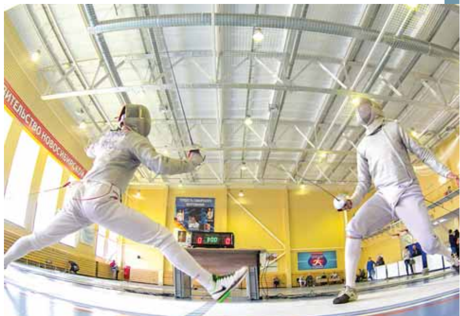
В этом году на турнир в Новосибирск придут около 300 участников.