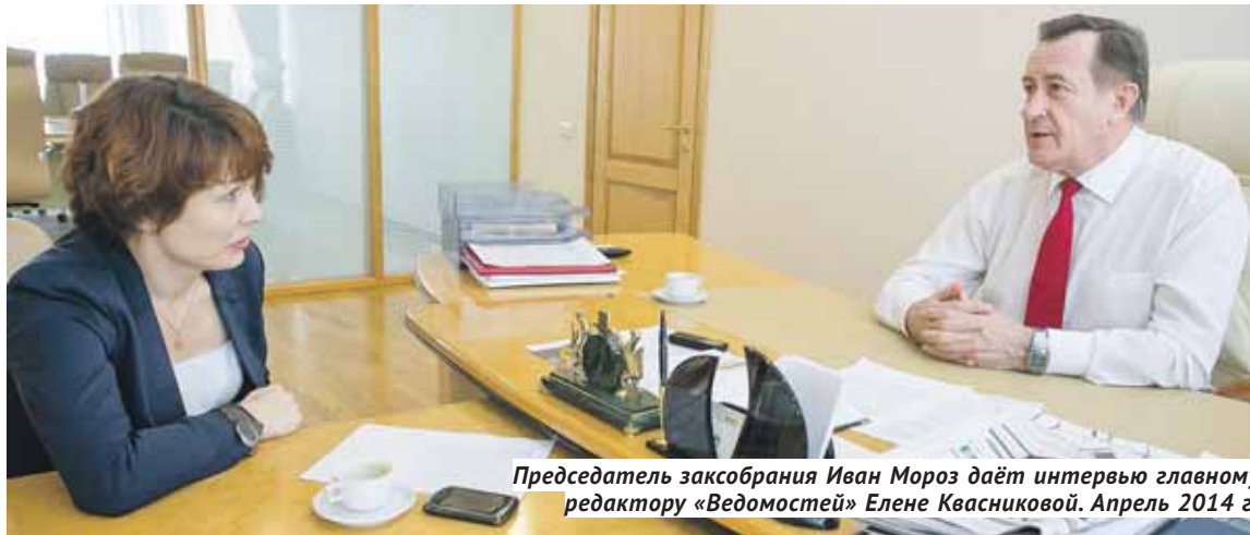
Председатель заксобрания Иван Мороз даёт интервью главному редактору «Ведомостей» Елене Квасниковой. Апрель 2014 г.

— Вы ожидали, что когда-нибудь станете председателем заксобрания?