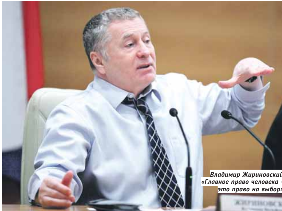
Владимир Жириновский: «Главное право человека – это право на выбор».

Известно, что каждый человек, попадая в новый коллектив, начинает приспосабливаться к его атмосфере, вести себя как все, чтобы стать частью этого социума. Но в этом, по мнению лидера ЛДПР, и заключается ошибка. Полностью подчиняясь коллективному разуму, индивидуум теряет самостоятельность: «Коллектив, безусловно, нужен. Но нужно уметь правильно смотреть на вещи и анализировать происходящее. Очень часто человек может стать жертвой чужих интересов. Посыл, который даёт ему определённый коллектив, может быть связан с чем-то плохим. Но человек ведь не знает этого, он не разобрался и